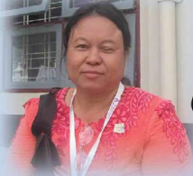
သရုပ်မှန်စုလဘာဉ်ရံဉ် (ဆိပ်ဗဲဒိဉ်တၢ်အိဉ်စိုဉ်သရုပ်မှန်, ကီၢ်ကယါဖိာ်ပှါ)

ဒီကရဲတဘျီအံၤ ယဲဟဲတုၤဒီးယသးခုဒိဉ်မးလီၤ ယထံဉ်ဘဉ် ကွၢ်တံၤသကိးလီၤလံာ်တဖဉ် ဒီးတံၤသကိးတဖဉ် ကဲထီဉ်ဒိဉ်လုာ်ဒိဉ် ပှၤဒိဉ်, တနီၤမၤန့ၢ်တၢ်လၢကမီၤဒီးကထာဉ်လဲန့ၢ်လီၤ ယဲဟဲတုၤဘဉ် ဒီကရဲတဘျီအံၤဒီး တၢ်သ့ဉ်နီဉ်ဆၢကုၤယၤလၢ ယသးပူၤနီဉ်တသ့ဘဉ် နီတဘျီ ဖဲယဲဟဲထီဉ်ဒိဉ်ကရဲတဘျီအံၤ ယဲဟဲထီဉ်တၢ်မၤလီၤ လံာ်စီဆံ့ အဆၢကတီၢ် ဒီးယဟးလၢပှၤပှၤ ယဒိသိလုဉ်ကွဲကမ့ဉ်ဒီး ပှၤဖိဉ်ယၤ, ယလံာ်တုၤဆူ ပၤကီၢ်အဂ္ဂု ယုာ်ဒီးယသးကဲဒီးန့ၢ်လီၤ အယံယဆၢ မှုာ်လံာ်လၢ ဖိာ်မှုာ်လၢ အဟဲထီဉ်ဒိဉ်ကရဲတဘျီအံၤ မဲအသုတဟးဆူန့ၢ် ဆူအံၤတဂ့ၢ် ဒီးကမၤလဲတၢ်ဂ့ၢ်ဘဉ်ဘဉ်န့ၢ်လီၤ မှုာ်အိဉ်လၢ ကစၢ် ပှၤကလုာ်ကထိပုၤန့ၢ်, ပကနၢ်ပုၤဘဉ်ကစၢ်ပှၤအကလုာ်ကထိန့ၢ်လီၤ မှုာ်အိဉ် လၢပှၤကလုာ်ကထိပုၤဘဉ်ဒီး ပှၤကတီၢ်ပှၤ, ကဖျုပှၤလီၤ.