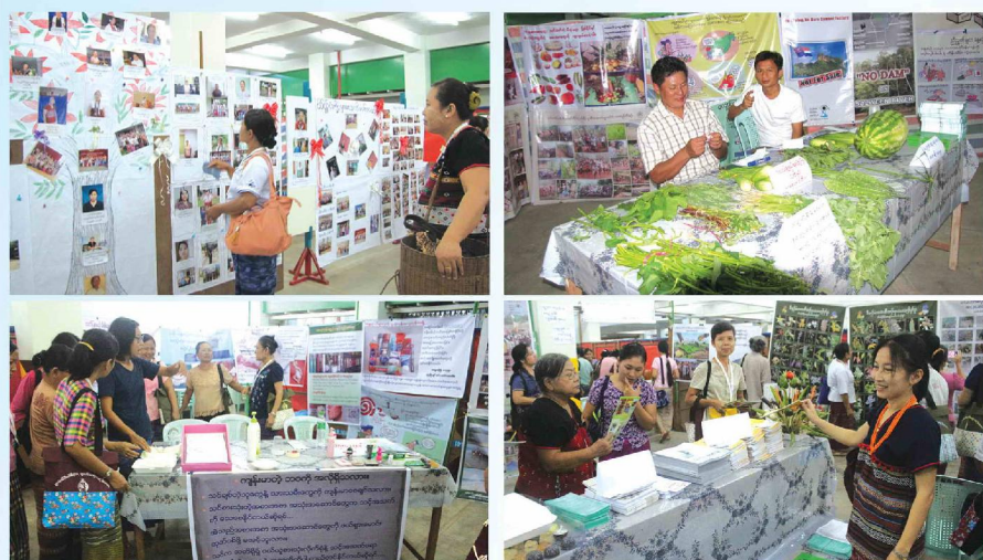
သရုပ်ဒိာ်တု (ဂ့ၢ်လုဉ်တၢ်အိဉ်စိုဉ်, ကီၢ်တက့ၢ်)

ဒီကရဲတဘျီအံၤ မှုာ်တၢ်အဆိကတၢ်လၢယကီၢ်လီၤ ယသးခု ဒိဉ်မးလၢ ယထံဉ်ဘဉ်ဒိဉ်န့ၢ် လုာ်ဒိဉ်ပှၤဒိဉ်တဖဉ်, တမံၤလီၤဆိတဖဉ် အယံလီၤ ထံဉ်ဘဉ်တၢ်အိဉ်ဒီး မၤလီၤန့ၢ်တၢ်လီၤ ဘဉ်ဆဉ် ယထံဉ် ဘဉ်လၢ တၢ်အိဉ်တၢ်ဆိးအလီၤန့ၢ် တၢ်တဘျီလီၤဘဉ်စးတဆဲးတက့ၢ် လီၤ. ပအိဉ်အလီၤ တၢ်လုဉ်ထံဒီးတၢ်ဟးလီၤဒီးအလီၤအိဉ်သယံ အိဉ်ဆုတဖျၢဉ်လီၤ. ဝဲပအိဉ်တၢ်လီၤ ပအိဉ် တဆဲးဆဲးအယံ ပမှုာ်အံၤဒီး လုဉ်ထံ ဘဉ်ဒီးလီၤသးဒီး တၢ်ဆၢကတီၢ်လၢလီၤ ယထံဉ်လၢ တၢ်လုဉ် ထံဒီးတၢ်ဟးလီၤဒီး မှုာ်အိဉ်တဖျၢဉ်စုာ်စုာ်န့ၢ် ကဂ့ၢ်ဒိဉ်ဝဲဒုဉ်လီၤ ဘဉ်ဆဉ်သ့ဉ်မှုာ်တၢ်တစီဖိ ဝဲပဟဲမၤလဲဘဉ်တၢ်အိဉ်အံၤလီၤ ဒီးလဲဉ်ဂ့ၢ် ပသးမံကစီဒီးလီၤ.